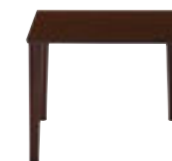
TB2890 - UX ¥98,500 900W 900D 698H