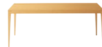
TB2103 - UD ¥221,000 1800W 900D 700H