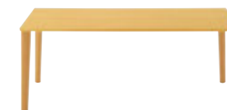
TB2883 - UX ¥154,900 1800W 900D 698H