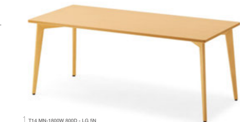
1 T14 MN-1800W 800D - LG 5N