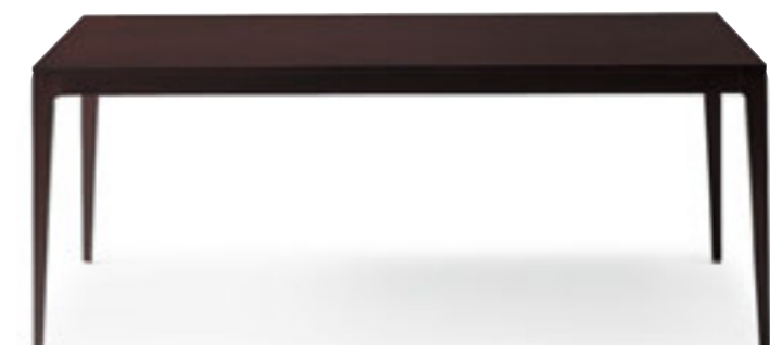
TB2113 - UD ¥221,000 1800W 900D 700H