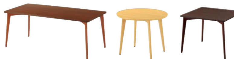
2 T21 3N-1800W 900D - LG 3N