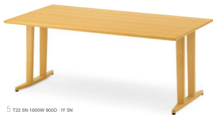
5 T22 5N-1800W 900D - IY 5N