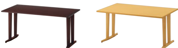
6 T09 1N-1500W 750D - IY 1N