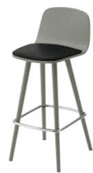
ペルセカウンターA WG ¥49,600 張材:レザー-B-15 (No.44)

パルマスH 5N ¥30,800 張材:レザー-B-15 (No.22) テーブル:TB2902 - LEH-SI (P374)