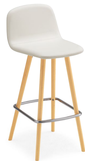
ペルセカウンターB 5N ¥54,400 張材:レザー-B-15 (No.35)