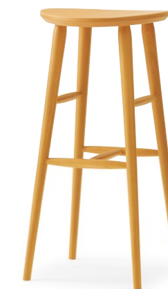
ソルドカウンターA 5NL ¥24,700