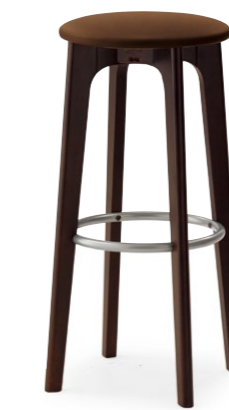
パルマスH 1N ¥30,800 レザー-B-15 (No.43)