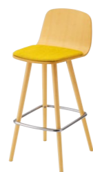
ペルセカウンターA 5N ¥49,600 張材:布地-B-18 (イエロー)