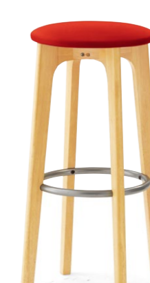
パルマスH 5N ¥30,800 レザー-B-15 (No.3)

高さが2種類から選べます。 Lタイプ (SH650) とHタイプ (H750) の 脚フレームがシーンに合わせて選べます。