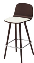
ペルセカウンターA 1N ¥49,600 張材:レザー-B-15 (No.35)