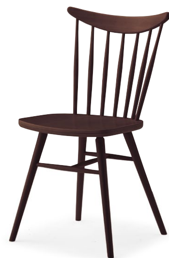
セトル 1N ¥29,500

スタンダードなウインザースタイル。ブナ材の木質豊かなシンプルなチェアです。飲食店やオフィスなど様々なシーンに合わせやすく、カウンタータイプもあるので統一感のあるコーディネートができます。