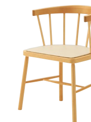
ミルラ NA (ZF9041付) ¥44,900 張材:レザー・A-80 (No.70)