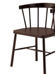
ミルラ DB ¥40,900