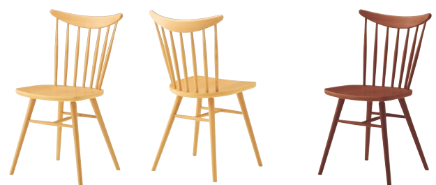
セトル 5N ¥29,500