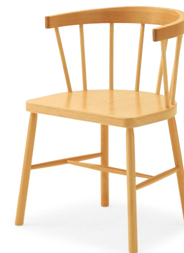
ミルラ NA ¥40,900