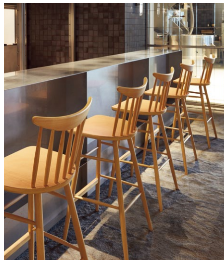
(写真上) セトルカウンター 5N ¥39,500