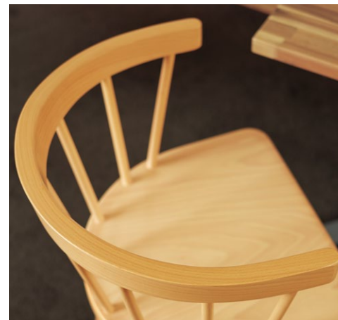
ミルラ NA (ZF9041付) ¥44,900 張材:レザー・A-80 (No.70) テーブル:TB3069 - GV-SI (P366)