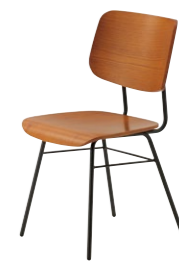
ミロス1 LB ¥34,800