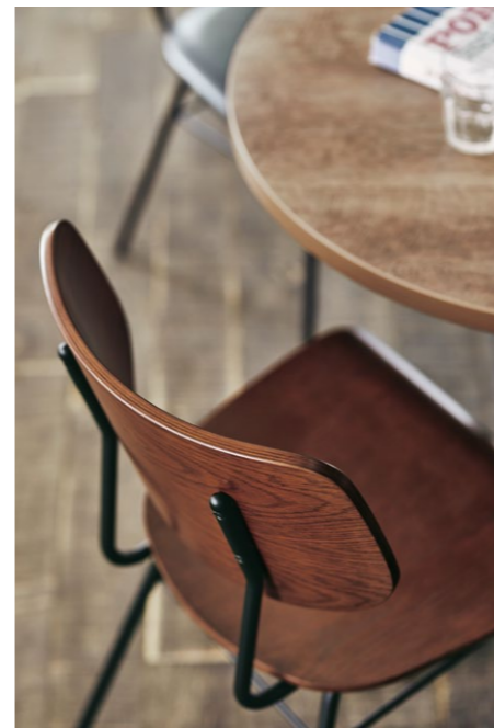
ミロス1 BR ¥34,800

体にフィットするプライウッドシート。オーク突板仕上による成型合板のシートは、計算された角度と形状により、体の一部になったかのような感覚です。2つの背からお選びください。