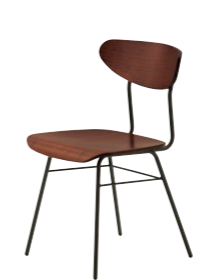
ビスト1 BR ¥33,100