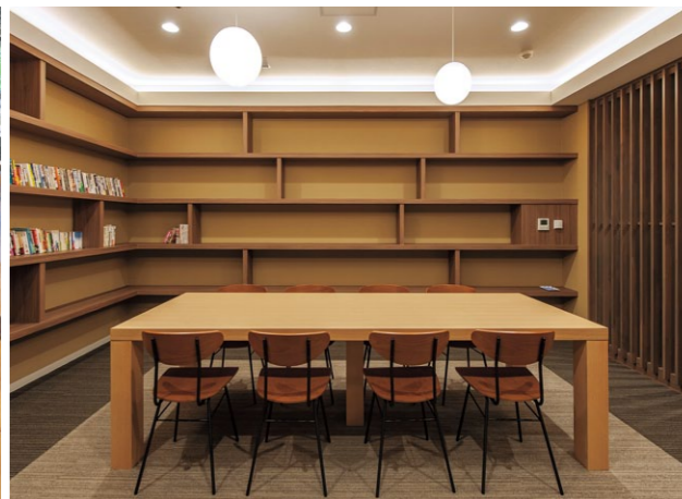
(写真右上) ビスト1 LB ¥33,100