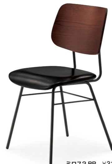
ミロス2 BR ¥31,700 張材:レザー・B-09 (No.10)