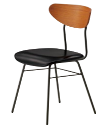
ビスト2 LB ¥30,100 張材:レザー・B-09 (No.10)