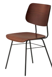
ミロス1 BR ¥34,800