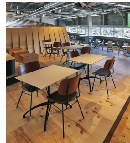
(写真上) ミロス2 BR ¥34,500 張材:レザー・ニフティ (L-2911)