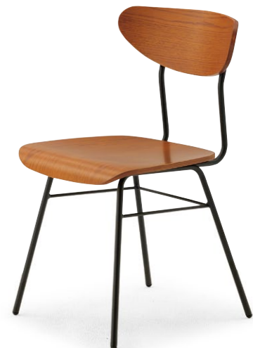
ビスト1 LB ¥33,100