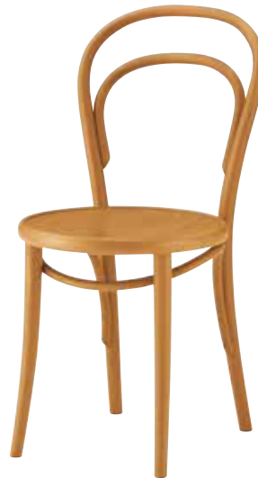
ミレナ1 HO ¥29,800

※この製品は一般製品に比べ材料の性質および加工方法により表示寸法と実寸に誤差が生じやすくなっております。