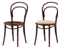
1 DB 2 DB 布地・C-42 (ベージュ)