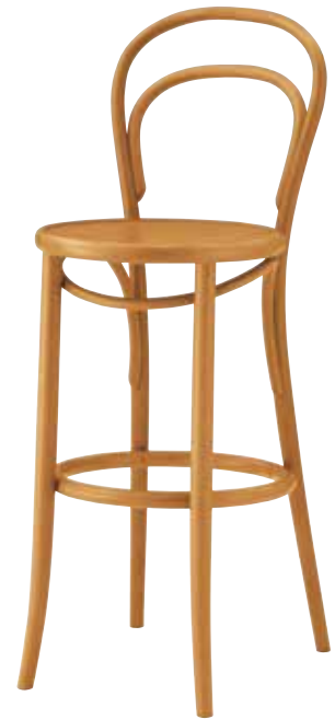
ミレナカウンター1 HO ¥46,900