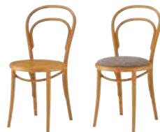
1 HO 2 HO レザー・C-38 (Na5)