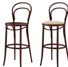
1 DB 2 DB 布地・C-42 (ベージュ)