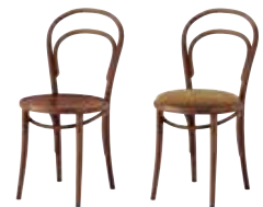
1 AC 2 AC 布地・D-59 (ライトブラウン)