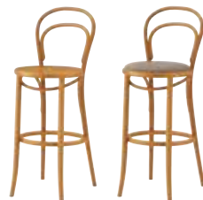
1 HO 2 HO レザー・C-38 (Na5)