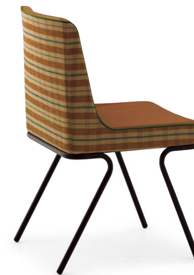
マリタA BL ¥51,800 張材:布地・D-65 (ブラウン) × レザー・B-15 (No.42) ※パイベン:レザー・B-15 (No.51) ※柄合せによる価格設定となっております。