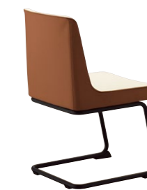
マリタB BL ¥48,700 張材:レザー・A-80 (No.26) × A-80 (No.70)