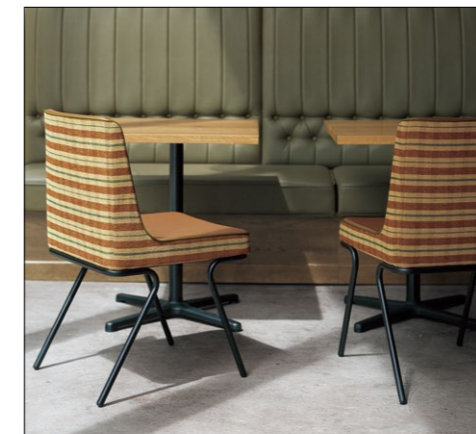
マリタA BL ¥51,800 張材:布地・D-65 (ブラウン) × レザー・B-15 (No.42) ※パイベン:レザー・B-15 (No.51) ※柄合せによる価格設定となっております。 テーブル:TB3029・GF-BL (P364)

モールドトップのボリュームを支えるチェア。コントラストのある量感のバランスを、パイベンと脚のカーブでシンクロさせ、モダンなスタイルに仕上げています。身体に馴染む広いシートは、程よい硬さのクッションで快適な掛け心地です。