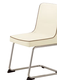
マリタB CR ¥49,000 張材:レザー・A-80 (No.70) ※パイベン:レザー・A-80 (No.26)