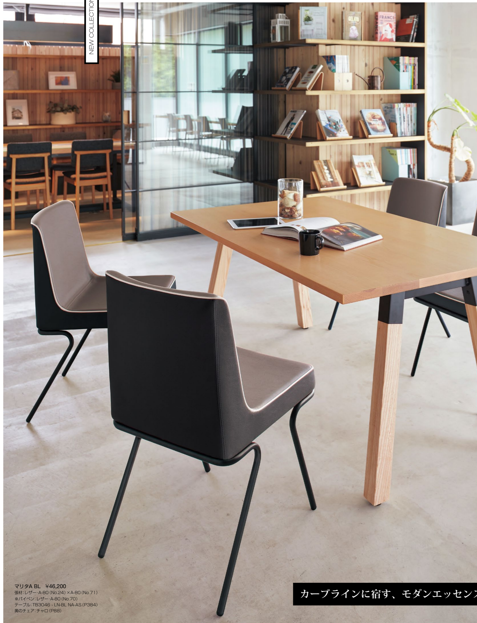
マリタA BL ¥46,200 張材:レザー・A-80 (No.24) × A-80 (No.71) ※パイベン:レザー・A-80 (No.70) テーブル:TB3046・LN-BL NA-AS (P384) 奥のチェア:チャロ (P88)