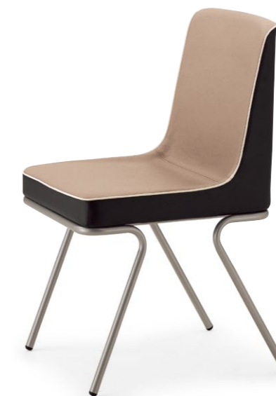
マリタA SI ¥46,200 張材:レザー・A-80 (No.24) × A-80 (No.71) ※パイベン:レザー・A-80 (No.70)