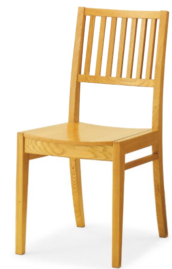
レサン1 5N ¥22,100