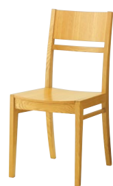
ルクマ1 5N ¥22,700