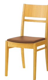
ルクマ2 5N ¥25,500 張材:レザー-A-80(No.26)