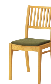
レサン2 5N ¥26,000 張材:布地-D-54(グリーン)