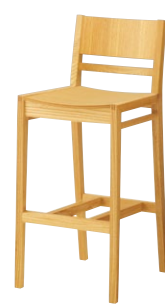
ルクマカウンター1 5N ¥34,400