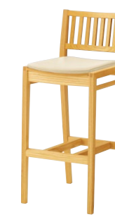
レサンカウンター2 5N ¥36,300 張材:レザー-B-15(No.37)