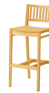
レサンカウンター1 5N ¥33,500