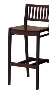
レサンカウンター1 1N ¥33,500