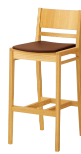
ルクマカウンター2 5N ¥36,800 張材:レザー-A-80(No.26)