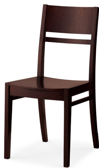
ルクマ1 1N ¥22,700