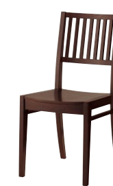
レサン1 1N ¥22,100