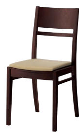
ルクマ2 1N ¥26,500 張材:レザー-C-12(No.3)