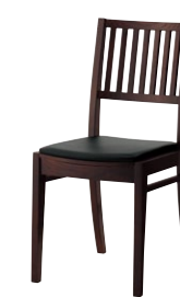
レサン2 1N ¥25,400 張材:レザー-B-15(No.22)