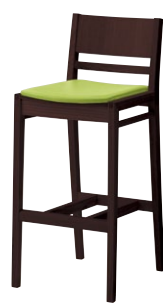
ルクマカウンター2 1N ¥37,300 張材:レザー-B-15(No.26)