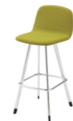
マートルカウンターB CR ¥36,000 張材:布地-B-18 (ライトグリーン)