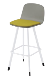
マートルカウンターA WH-WG ¥35,200 張材:布地-B-18 (ライトグリーン)