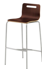
キーノカウンター1 MD ¥24,700