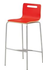
キーノカウンター1 MR ¥23,800