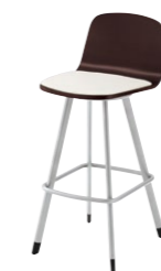
マートルカウンターA SI-1N ¥35,200 張材:レザー-B-15 (No.35)