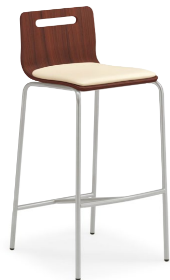
キーノカウンター2 MX ¥29,000 張材:レザー-A-80 (No.70)