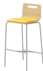
キーノカウンター2 MN ¥29,000 張材:レザー-A-80 (No.40)