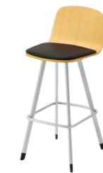
マートルカウンターA SI-5N ¥35,200 張材:レザー-B-15 (No.44)