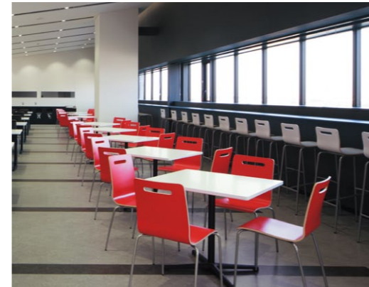
(写真上) キーノカウンター1 MW ¥23,800 キーノ1 MR ¥18,700