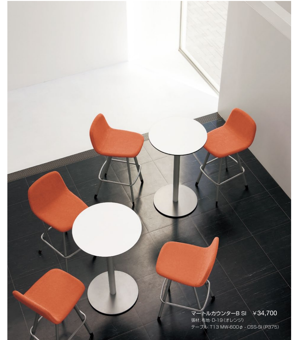
マートルカウンターB SI ¥34,700 張材:布地-D-19 (オレンジ) テーブル:T13 MW-600φ・CSS-SI (P375)