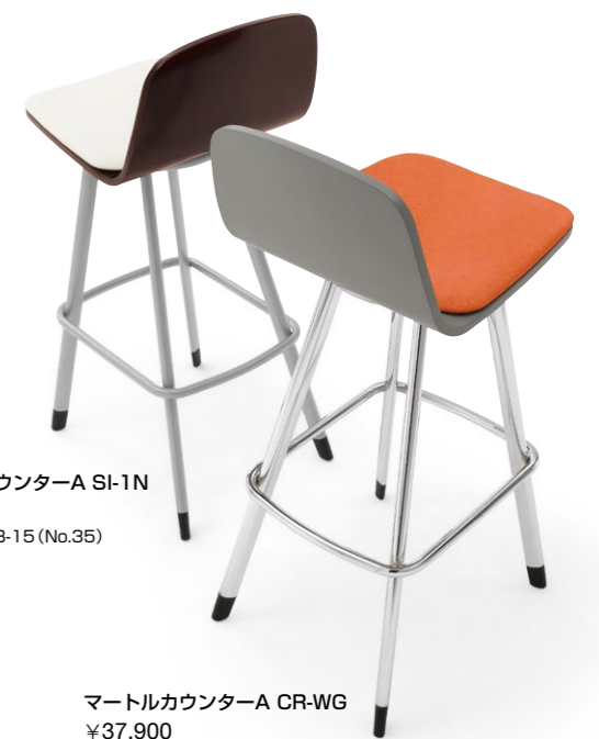
マートルカウンターA SI-1N ¥35,200 張材:レザー-B-15 (No.35)