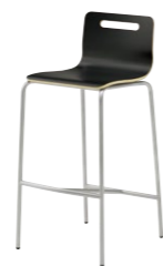
キーノカウンター1 MB ¥23,800