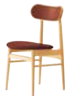
B 5N レザー・B-25 (No4)

張地ランク A 31,800 B 33,000 C 33,900 D 34,500 S 37,000 L 39,700 H 42,500