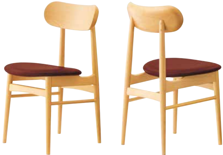
ケルスA 5N ¥26,100 張材:レザー・B-25 (No4)