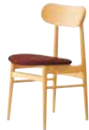
A 5N レザー・B-25 (No4)

張地ランク A 25,700 B 26,100 C 26,500 D 26,700 S 27,600 L 28,700 H 29,700