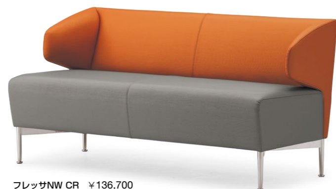
フレッサNW CR ¥136,700 張材:レザー・C-17 (No.3) × C-17 (No.10)