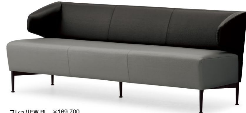
フレッサEW BL ¥169,700 張材:レザー・C-17 (No.11) × C-17 (No.10)