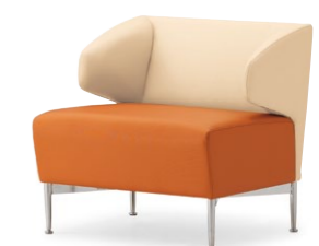
フレッサW CR ¥102,800 張材:レザー・C-17 (No.6) × C-17 (No.3)