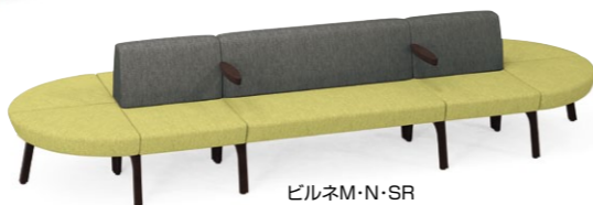
ビルネM・N・SR JL1N・CL1N・H1N 張材:布地-D-55(グレー)×D-55(ライムグリーン)