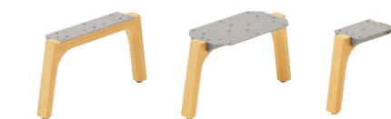
張地ランク A 24,400 B 25,400 C 26,100 D 26,800 S 28,800 L 31,300 H 34,500 SL(エンド脚) ¥15,400 JL(ジョイント脚) ¥20,500 CL(コーナー脚) ¥10,400

軽快なシステムユニット。全17タイプの形状パリエーションの組み合わせでどんなシーンにも自在にレイアウトできます。木製脚は2色から選べ、冷たくなりがちなロビー空間に暖かい印象を与えます。