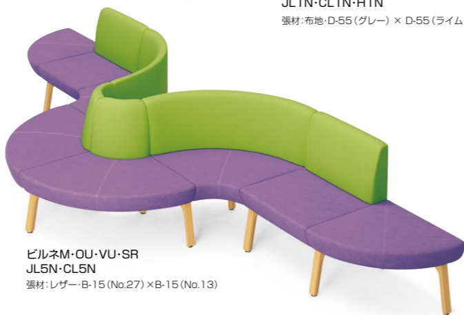
ビルネM・OU・VU・SR JL5N・CL5N 張材:レザー-B-15(No.27)×B-15(No.13)