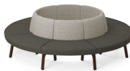
ビルネONR JL1N 張材:布地-D-55(ライトグレー)×D-55(グレー)