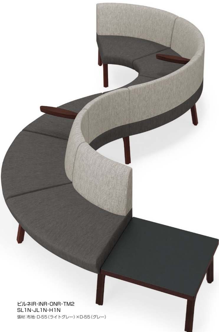
ビルネIR・INR・ONR・TM2 SL1N・JL1N・H1N 張材:布地-D-55(ライトグレー)×D-55(グレー)