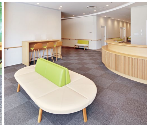
(写真左) ビルネM・SM・ONR・扇形スツール(特注)・JL1N・SL1N 張材:レザー・セラファイトZF05 チェア:バンセW 1N(P78) (写真右) ビルネN・SR・JL5N・CL5N 張材:レザー-C-12(No.11)×C-12(No.1) 奥のチェア:ベルセカウンターA 5N(P246)