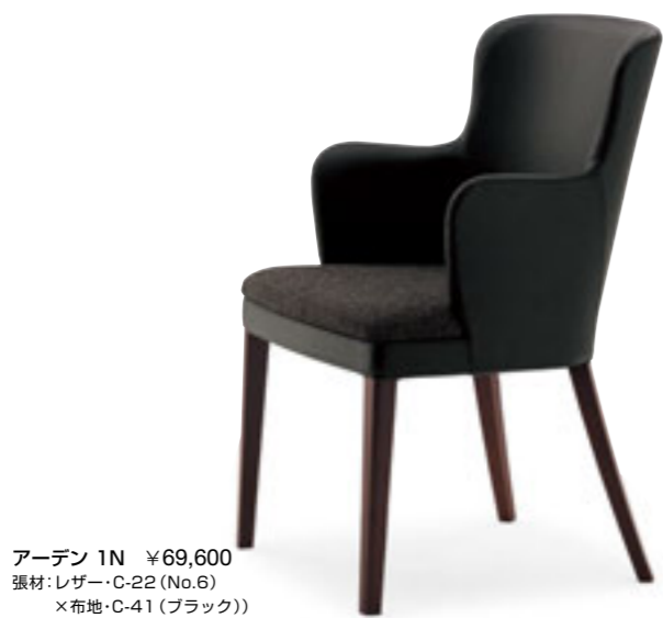
アーデン 1N ¥69,600 張材: レザー・C-22 (No.6) × 布地・C-41 (ブラック)