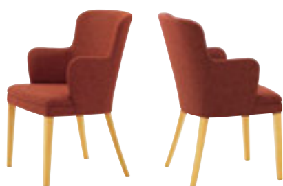
アーデン 5N ¥70,300 張材: 布地・D-23 (ローズ)