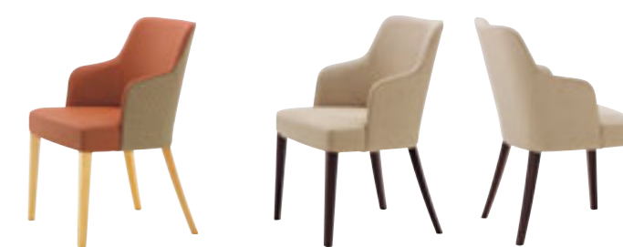
アルクス 5N ¥71,600 張材: 布地・ファベル・イース (T-4484) × レザー・C-22 (No.43)