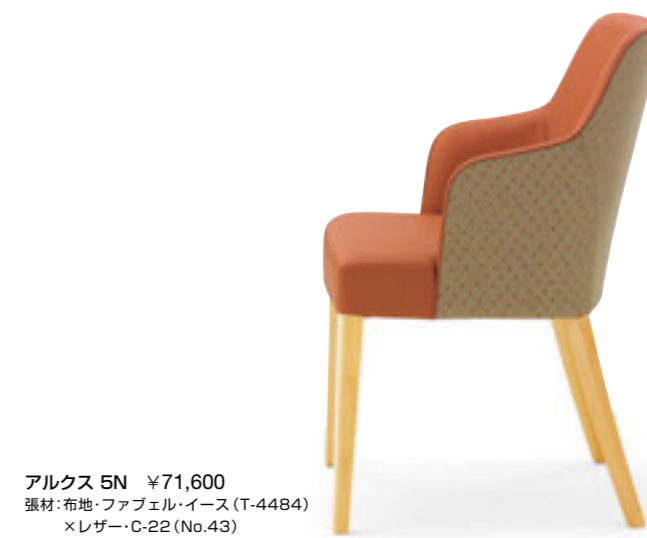
アルクス 5N ¥71,600 張材: 布地・ファベル・イース (T-4484) × レザー・C-22 (No.43)