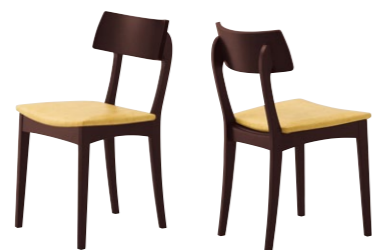
アデス 1N ¥26,800 張材:レザー・B-25(No.2)