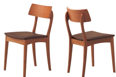
アデス 3N ¥27,200 張材:レザー・C-44(No.4)