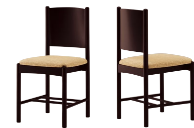
エトーレ 1N ¥30,700 張材:レザー・C-50(No.1)