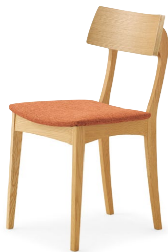
アデス NA ¥27,200 張材:布地・C-42(オレンジ)