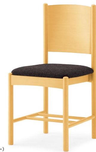
エトーレ 5N ¥30,700 張材:布地・C-42(ダークグレー)