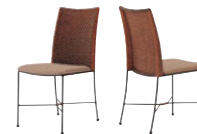
アデオ ¥41,600 張材:レザー・A-80 (No.71)