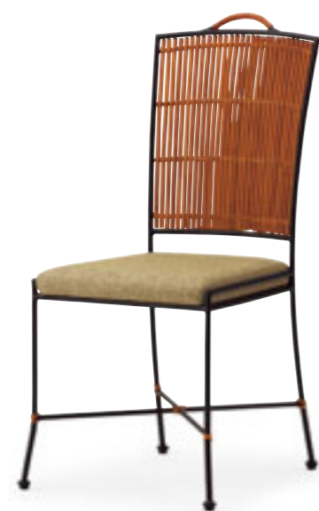
カウル ¥29,000 張材:布地・D-23 (ベージュ)

(写真左) カウル ¥27,000 張材:レザー・A-80 (No.68) テーブル:T13 MD-600W 750D - SF-BM (P354)