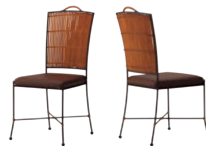
カウル ¥28,400 張材:レザー・C-51 (No.2)

(写真左) アデオ ¥42,600 張材:布地・D-54 (グリーン) テーブル:TB2735 - QV-MB (P369)