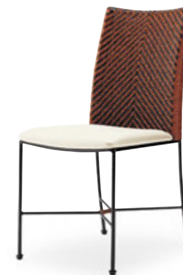
アデオ ¥42,400 張材:レザー・C-22 (No.1)

※P214・P215の製品は一般製品に比べ材料の性質および加工方法により表示寸法と実寸に誤差が生じやすくなっております。