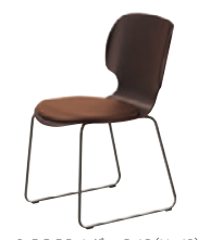
2 DG-DB レザー-B-15 (No.42)