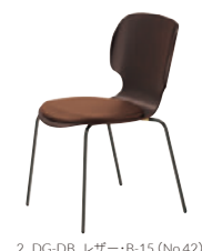
2 DG-DB レザー-B-15 (No.42)

ZF9122 ¥4,400 座面に載せる置きクッションもあります。 裏面は滑り止め加工が施してあるので安心です。 (座厚6mm)裏材はA-80からお選びください。