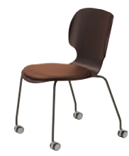
2 DG-DB レザー-B-15 (No.42)