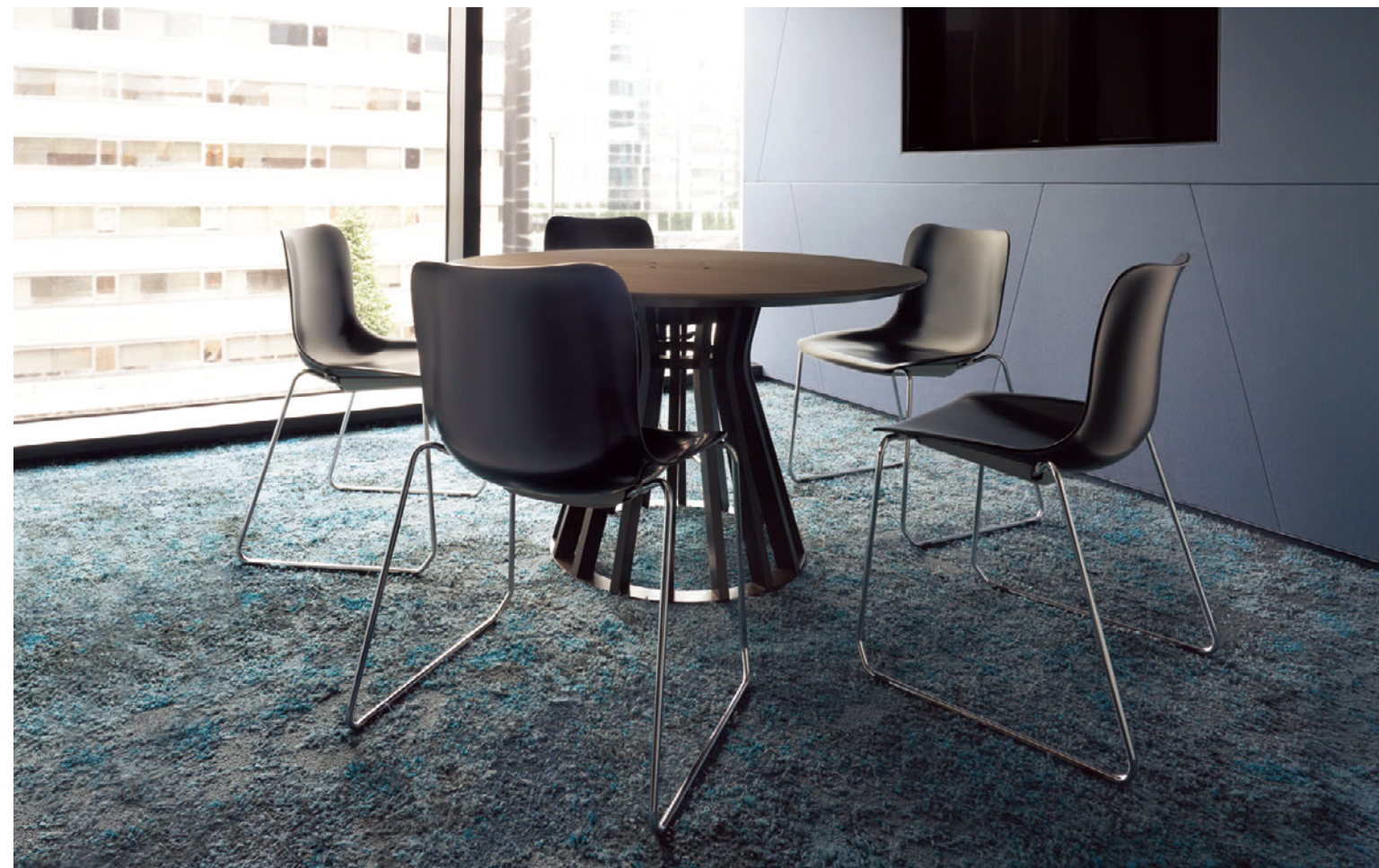
▲ハベスA1DG-NA ¥42,900 テーブル:TB2729-GM-BL (P329) 奥のカウンターチェア:タッソカウンター-C (P230) 奥のソファ:リーゼルW5N (P254) 奥のテーブル:T09 5N-1200W 600D -LEL-DG (P322)