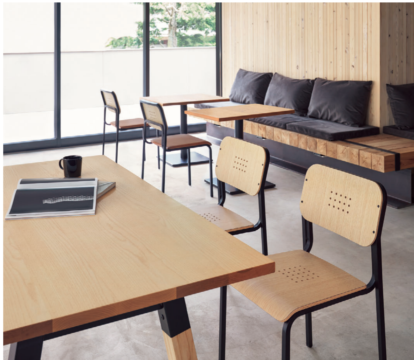
▲レベカ1 BL-MN ¥37,400 レベカ2 BL-MN ¥37,500 張材:レザー-B-25 (No.3) テーブル:TB3046-LN-BL NA-AS (P325) TB3049-EV-BL (P325)