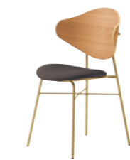
2 GL-MN レザー-C38 (No.13)