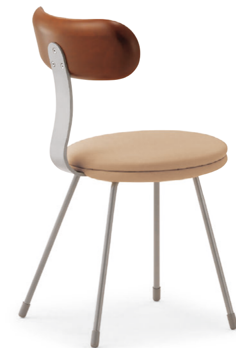
コルピASI-3N ¥35,100 張材:レザー-C-22 (No.2)

◀コルピDG-5N ¥34,200 張材:布地-B-77(ライトブルー、ピンク、ライトグリーン) テーブル:FT2-A01-500W 500D・GM-BL (P309) 奥のチェア:バサロAWCR (P142)