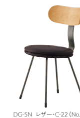
DG-5N レザー-C-22 (No.46)