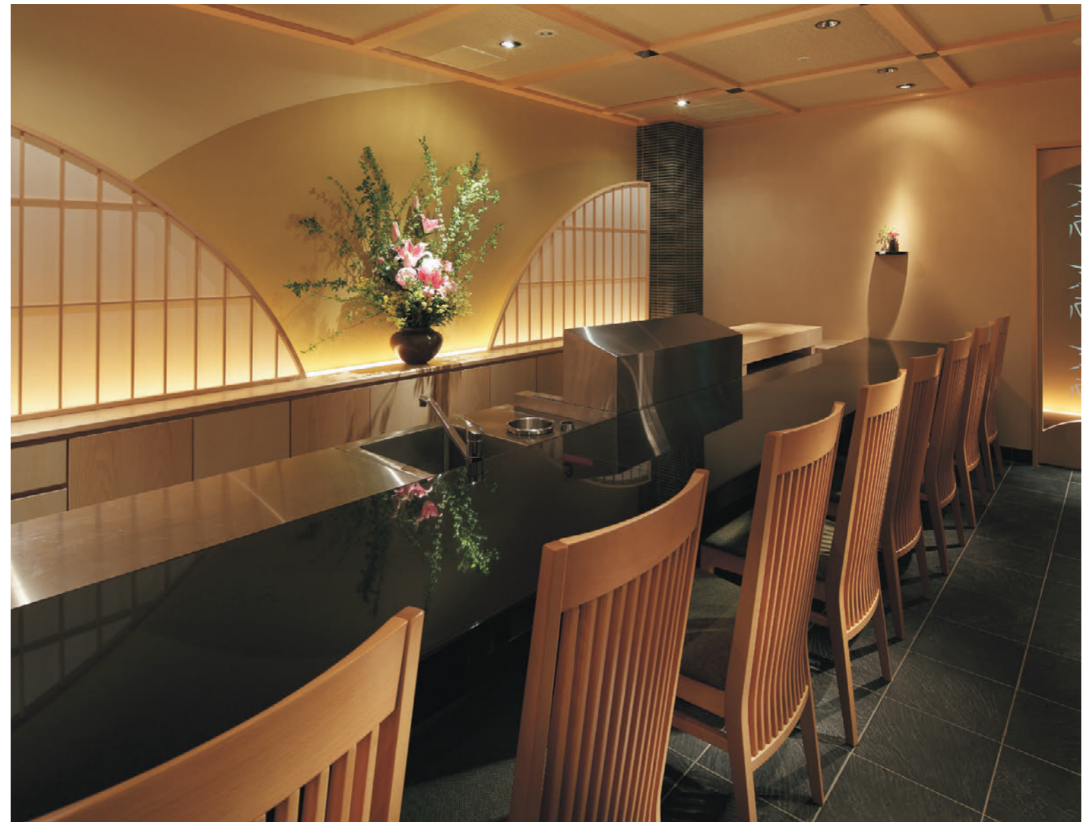
▲サルミ 5N 張材:布地