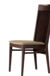
1N レザー-B-26 (No.1)