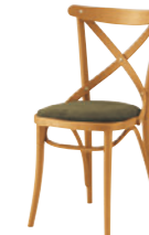
2 HO 布地・C-52 (オリーブ)